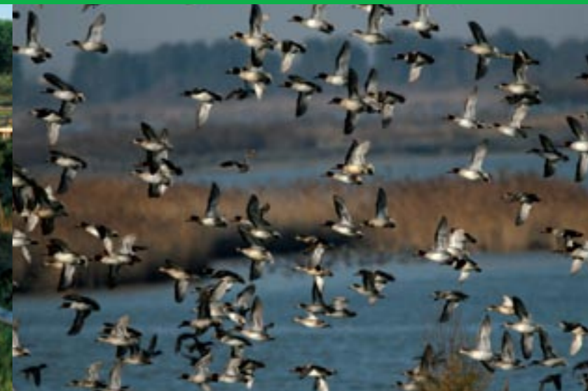
Porto Tolle, anatidi in valle

I l Gruppo di Azione Locale (GAL) Polesine Delta del Po è una Associazione riconosciuta dalla Regione Veneto, nata nel 1994 con l’Iniziativa Comunitaria LEADER II, con l’obiettivo di realizzare progetti a favore dello sviluppo del territorio e del turismo rurale della provincia di Rovigo.