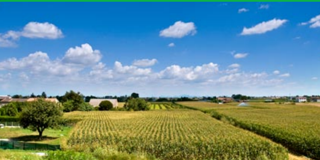
Stienta, paesaggio rurale