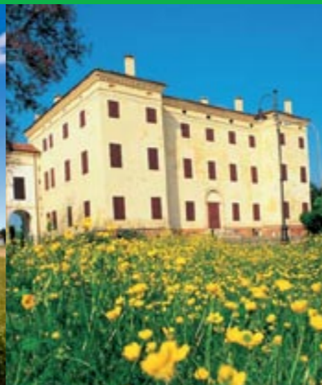
Trecenta, Palazzo Pepoli