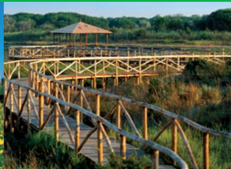
Rosolina, giardino botanico litoraneo di Porto Caleri